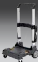
TROLLEY TSTAK DWST1-71196