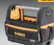
BOLSA ABIERTA TSTAK DWST82990-1