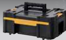
CAJONERA TSTAK III DWST1-70705