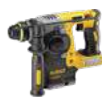
MARTILLO SDS PLUS® 2,1J DCH273N