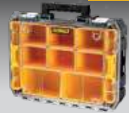
ORGANIZADOR SELLADO TSTAK V DWST82968-1