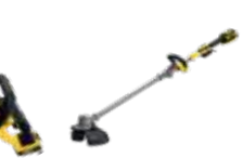
CORTABORDES 36cm DCMST561N