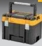
CAJA CON ASA LARGA TSTAK DWST83343-1