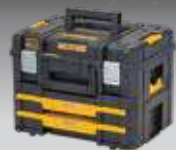
MALETA TSTAK II + CAJONERA DOBLE TSTAK IV DWST83395-1