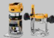
FRESADORA COMBO DCW604NT