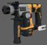
MARTILLO SDS PLUS® 1,4J DCH172NT