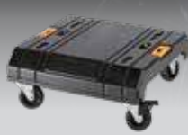
CARRO CON RUEDAS TSTAK DWST1-71229