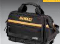
BOLSA CERRADA TSTAK DWST82991-1