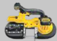
SIERRA DE BANDA 63mm DCS371N