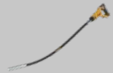
VIBRADOR DE HORMIGÓN DCE531N