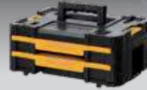
CAJONERA DOBLE TSTAK IV DWST1-70706