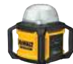
LUZ LED DE ÁREA DCL074