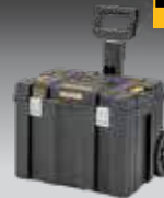
ALMACENAJE MÓVIL TSTAK DWST83347-1