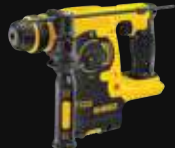
MARTILLO SDS PLUS® 2,1J DCH253N