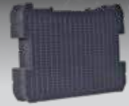
ESPUMA PRE-CORTADA TSTAK DWST1-72364