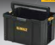
CAJÓN ABIERTO TSTAK DWST1-71228