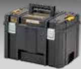
CAJA PROFUNDA TSTAK VI DWST83346-1