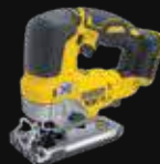
SIERRA DE CALAR DCS334NT